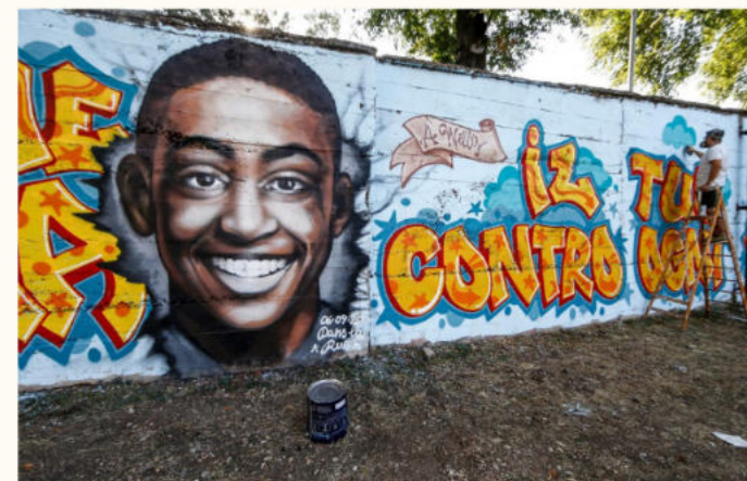
Murales di Willy Monteiro, 2020, Zona Ostiense, Roma

Quest'anno studiamo.. "Insieme con Willy"